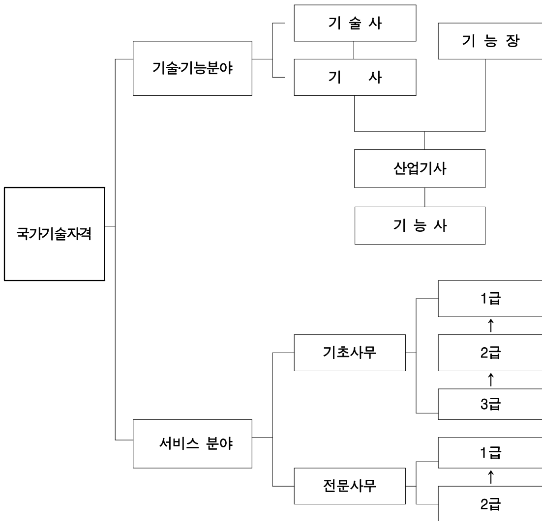
[그림 2] 국가기술자격제도 체계